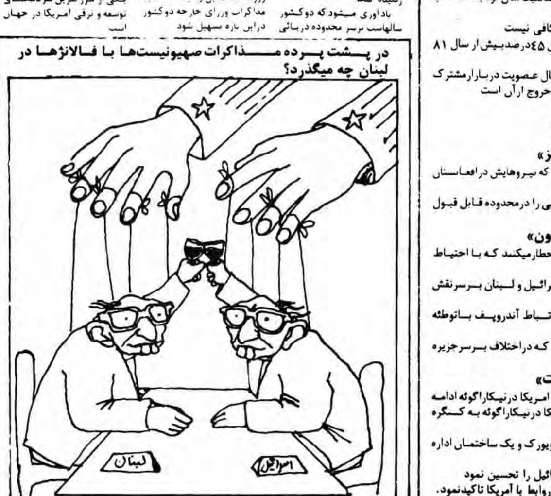
در پشست پیگرد مسزاکرات صهیونیستها با فالانژها در لبنان چه میگذرد؟

روزنامه «السیاسه» نمیری برای معاینات پزشکی امروز وارد واشنگتن میشود