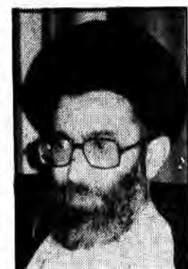
جمعی از علمای اهل تسنن و تشیع منطقه گرگان و گنبد

وزارت امور خارجه جمهوری اسلامی ایران در پاسخ به یادداشت وزارت امور خارجه شوروی در رابطه با راهپیمایی و تظاهرات اخیر مسلمانان افغانی در اطراف سفارت شوروی پاسخ داد. متن پاسخ وزارت امور خارجه کشورمان باین شرح است: