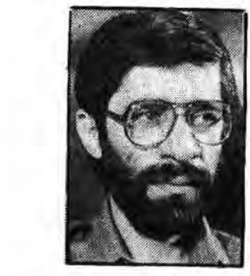
عراق اکنون به ابزار متکی است به این معنی که از نیروی انسانی تکی شده است و از نیروی مادی و تجهیزات کمتری برخوردار است...