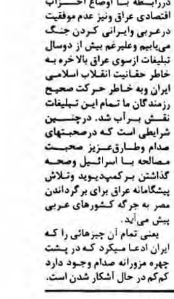
عراق اکنون به ابزار متکی است به این معنی که از نیروی انسانی تکی شده است و از نیروی مادی و تجهیزات کمتری برخوردار است...