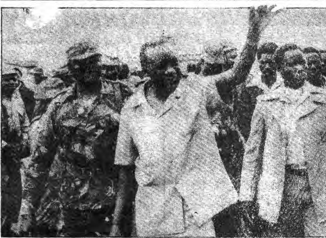
«لوله» رئیس جمهور پیشین اوگاندا، اکنون رهبر یک جنبش چریکی است