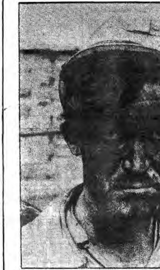
عکسها سخن میگویند