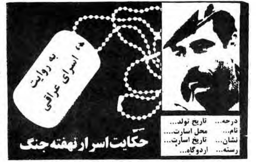
درجه... تاریخ تولد... نام... محل اسارت... نشان... تاریخ اسارت... رسته... اردوگاه...