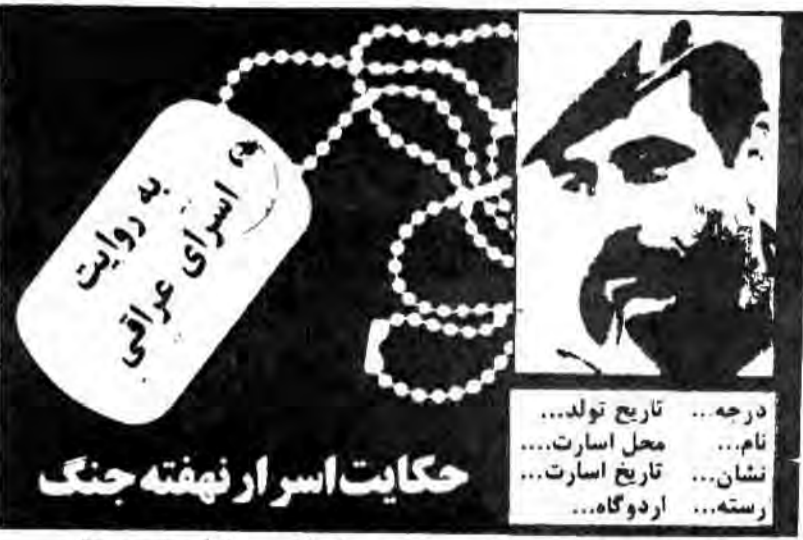
حکایت اسرارنامه جنگ... سلسله مصاحبه‌های جمهوری اسلامی با اسرای عراقی

شهر چند میلیون جمعیتی و بقیه شهرهای ایران به وجود آورید. پیغمبر اسلام وقتی می‌خواهند عالیترین نعمت را معرفی کنند می‌گویند: دو نعمت است که مردم قدش را نمی‌دانند یکی سلامتی و دیگری امنیت است. اینها قاطعانه برخورد کنید. باید اینها را شما بترسند من مسلمان وقتی که شما را می‌بینم باید گریه شوق بریزم و در مسلمان وقتی که شما را می‌بینم باید افتخار کنم و با حفظ حقوق جامعه است و با اقدامات گوناگونی هست و اجرت کارگر بیشتر شده و تولید افزایش یافته است و معمولاً وجه روستاها بهتر شده است. چه شده است که از همان روستاها برای سبزی می‌برند؟ اگر مسئله فشار باشد که نباید بترسند. میگوید فشار اقتصادی، خوب است. روستایی با همان نباید ببرد. روستایی با همان کارگری جزئی می‌سازد و در روستا زندگی می‌کند و شرایط هم برای فراهم است. پس فشار او را نمی‌برد ایمن او را برد. معمولاً کسانی که شهید میشوند از خانواده‌های محروم اما محرمیت نبرده است ایمن برده است. وی سپس افزود: ما در زمانی زندگی می‌کنیم که مردش مسلمان هستند و دلش شهید پرور، در زمانی که فرمودند زندگی می‌کنیم که قدرت و سلطنت از آن مسلمانان است و در دورانی که حاکمیت از آن خوران است. حالا دوستان می‌بینند که چقدر از آن بی‌خبرند و بی‌مبایست است. باید بدانیم که در این شرایط ما باید مقادیر می‌سرمان پیدا کنیم. اینها را حاکمیت می‌بیند و به بی‌گناهی می‌کشند. اینها را حاکمیت می‌بیند و به بی‌گناهی می‌کشند. اینها را حاکمیت می‌بیند و به بی‌گناهی می‌کشند. اینها را حاکمیت می‌بیند و به بی‌گناهی می‌کشند.