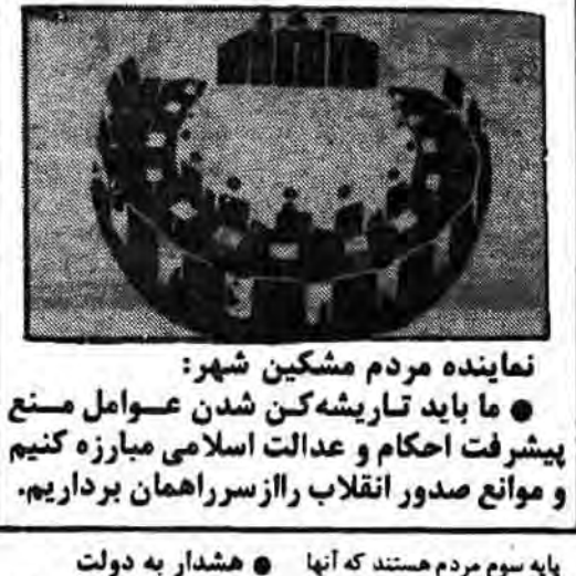
نماینده مردم مشکین شهر

سخنران نماینده مردم در بیانیه‌ای که به اطلاع رسانان رسانید، به موضوعات مهمی اشاره کرد. او اظهار داشت که ملت ایران با وجود همه مشکلات و چالش‌ها، با ایمان و وحدت می‌تواند به اهداف خود دست یابد.