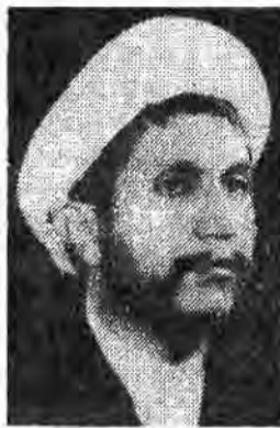
آیتالله صناعی در دیدار با واحد گشت ثارالله سپاه...

شهر چند میلیون جمعیتی و بقیه شهرهای ایران به وجود آورید. پیغمبر اسلام وقتی می‌خواهند عالیترین نعمت را معرفی کنند می‌گویند: دو نعمت است که مردم قدش را نمی‌دانند یکی سلامتی و دیگری امنیت است. اینها قاطعانه برخورد کنید. باید اینها را شما بترسند من مسلمان وقتی که شما را می‌بینم باید گریه شوق بریزم و در مسلمان وقتی که شما را می‌بینم باید افتخار کنم و با حفظ حقوق جامعه است و با اقدامات گوناگونی هست و اجرت کارگر بیشتر شده و تولید افزایش یافته است و معمولاً وجه روستاها بهتر شده است. چه شده است که از همان روستاها برای سبزی می‌برند؟ اگر مسئله فشار باشد که نباید بترسند. میگوید فشار اقتصادی، خوب است. روستایی با همان نباید ببرد. روستایی با همان کارگری جزئی می‌سازد و در روستا زندگی می‌کند و شرایط هم برای فراهم است. پس فشار او را نمی‌برد ایمن او را برد. معمولاً کسانی که شهید میشوند از خانواده‌های محروم اما محرمیت نبرده است ایمن برده است. وی سپس افزود: ما در زمانی زندگی می‌کنیم که مردش مسلمان هستند و دلش شهید پرور، در زمانی که فرمودند زندگی می‌کنیم که قدرت و سلطنت از آن مسلمانان است و در دورانی که حاکمیت از آن خوران است. حالا دوستان می‌بینند که چقدر از آن بی‌خبرند و بی‌مبایست است. باید بدانیم که در این شرایط ما باید مقادیر می‌سرمان پیدا کنیم. اینها را حاکمیت می‌بیند و به بی‌گناهی می‌کشند. اینها را حاکمیت می‌بیند و به بی‌گناهی می‌کشند. اینها را حاکمیت می‌بیند و به بی‌گناهی می‌کشند. اینها را حاکمیت می‌بیند و به بی‌گناهی می‌کشند.