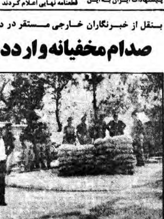
مردوان صدام سفارتخانه عراق در دهلی نو را سرنگرندی کرده‌اند.

خبرنگاران خارجی مستقند که صدام همراه ۱۵۰ کماندوی عراقی مخفیانه وارد هند شده و در سفارتخانه این کشور مخفی گردیده است.