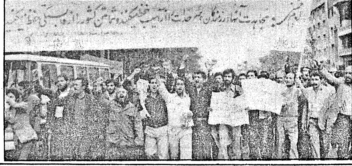
با صدور قطعنامه‌ای: سومین کنگره هزاره نهج البلاغه بکار خود پایان داد

روز کارگر بار اهیمائیهای عظیم کارگران در سر اسر کشور برگزار شد شعار مرگ بر آمریکا، مرگ بر توده‌های، دیروز فضای ایران اسلامی را فرا گرفت