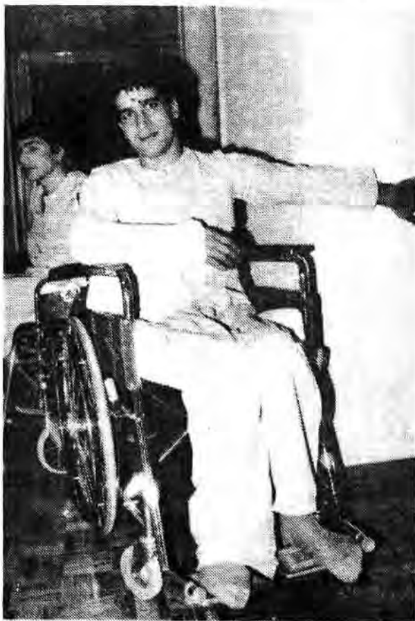
بطور جداگانه به همسر و فرزندان و پدر و مادر الرامی است.

اقدامات ضروری بنیاد شهید در همین دستخط که اسام است به شورای انقلاب نوشته اند، حجت الاسلام شیخ مهدی کروی که از چهره های مبارز و شناخته شده روحانیت هستند، تعیین میشوند و به کار گمارده میشوند. اکنون که آگاهی یافتیم سازمان یا بنیاد شهید چگونه شکل گرفته و چه خدمات یا وظایفی را میبایست انجام می داده، به گوشه هایی از اقدامات بعمل آمده توسط بنیاد اشاره میکنیم. برای خانواده شهدا و معلولین انقلاب و جنگ تحمیلی عراق و ایران براساس