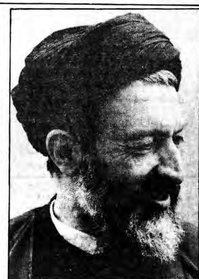
شهید مظلوم آیتا... بهشتی در اجتماع مردم قم بمناسبت سالروز پیروزی انقلاب:

شهریور میگردد. حضور و خواست مردم حضور شما مردم قهرمان در سراسر ایران و فریاد شما اینکه ای آمریکا تو خیلی چیزها میخواستی و میخواهی، ولی باید بدانی ملت ما قیام کرد خون داد، شهید داد، حرکت کرد سالها رنج برد تا دیگر ارباب نداشته باشد ما میخواهیم همچنان استقلالمان را در برابر توطئه آمریکا با تمام وجود نگیانی کنیم آمریکا برای ما مشکل اقتصاد ایجاد کرد گفت شما حاضر نیستید حرف بشنوید ما حرف را با اهرم توی گوشتان میکنیم. ما را تحت فشار اقتصادی قرار داد حمله نظامی طریق مزدورانش در سرزمین پاک عراق که امروز با وجود این حکومت یعنی مزدور از پاکیش کاسته شده باید ملت قهرمان عراق این لوث حکومتی یعنی از این سرزمین پاک یکد آمریکا آمد از طریق مزدوران یعنی اش به ما حمله کرد جنگ راه انداخت و جالب این است که این پرووها این ور و آن ور میگویند ایران به عراق تجاوز کرده است. اینها نه غفل دارند نه دین نه حیا دارند دیگر همه میدانند که آن کسی که تجاوز کرده و لشکر کشی کرده است کسی است ایران است یا عراق ما میگفتیم انقلاب خود را صادر میکنیم حالا هم سرزمینهای مجاورمان لشکر کشی میکنیم. امام امت مکرر فرموده بودند مسئولان کشور مکرر گفتند ملت ما مکرر گفتند، گفتند ما با ایجاد جامعه الگو و امت وسط و نمونه و با حمایت از مردم انقلابی کشورهای اسلامی انقلاب اسلامی را صادر