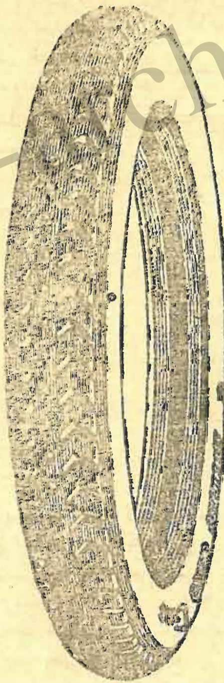
محل فروش خيابان اسلامبول مفازه حبي آقا رحيم زاده

از جهت جنس و دوام در اولين درجه واقع است امتحان کنيد تا مطمئن شويد خيابان لاله زار مفازه شرکت پلايه