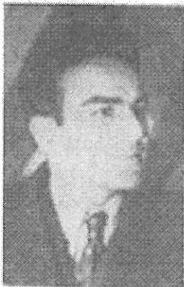
رفیق مصطفی بزرگ نیا

کمیته مرکزی حزب توده ایران ۱۶ آذرماه ۱۳۸۲