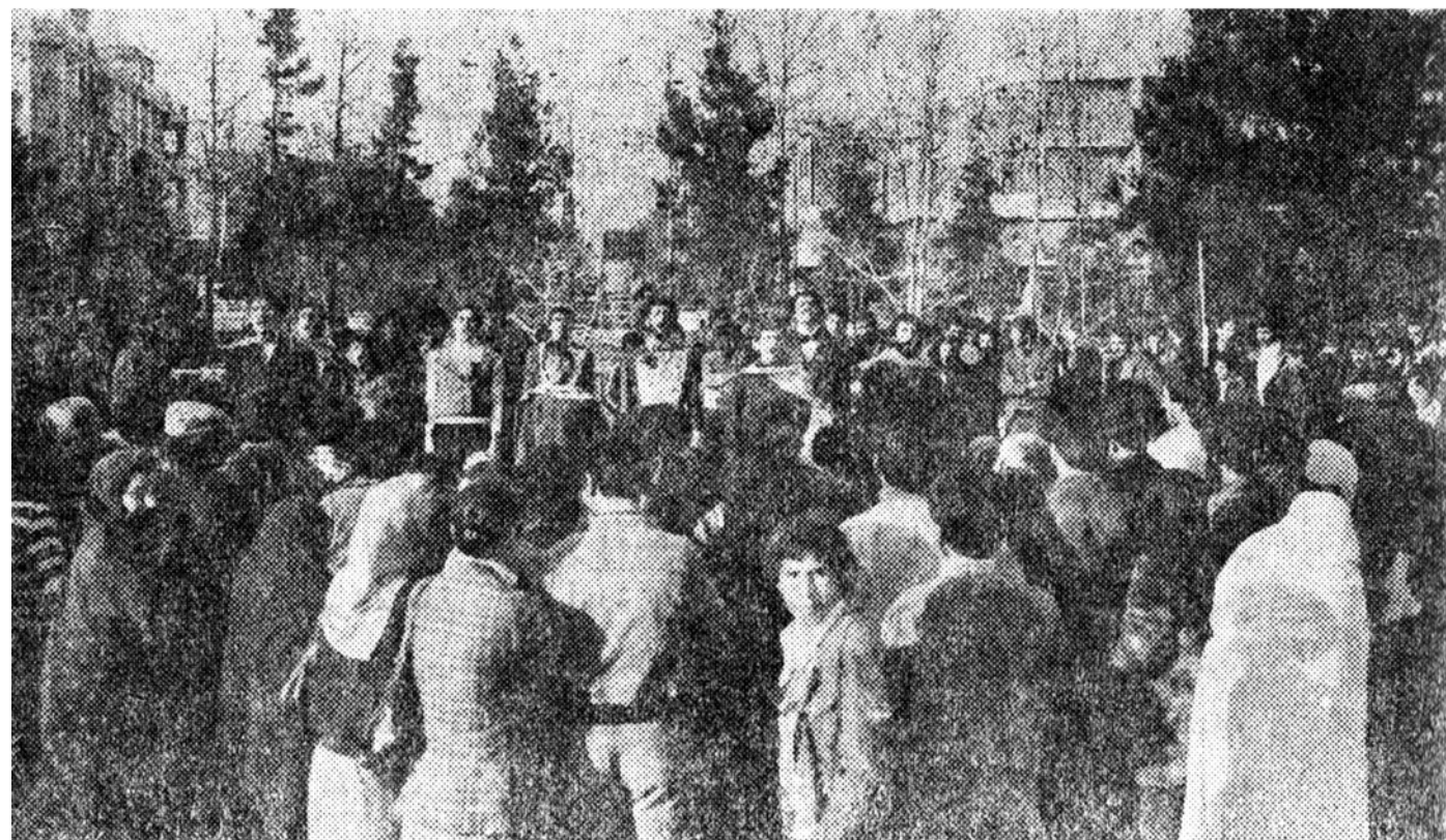
اجرای «لوطی عنتری» در میدان هفت حوض نارمک