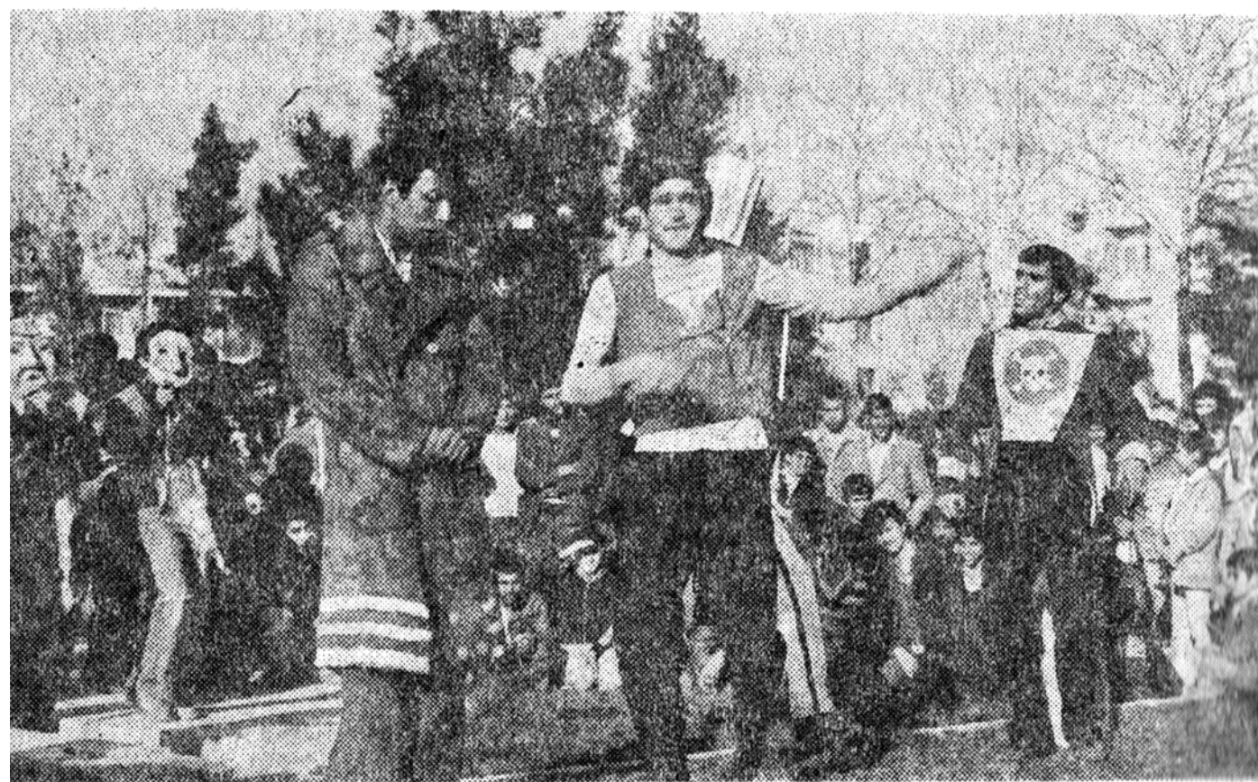
اجرای «لوطی عنتری» در میدان هفت حوض نارمک