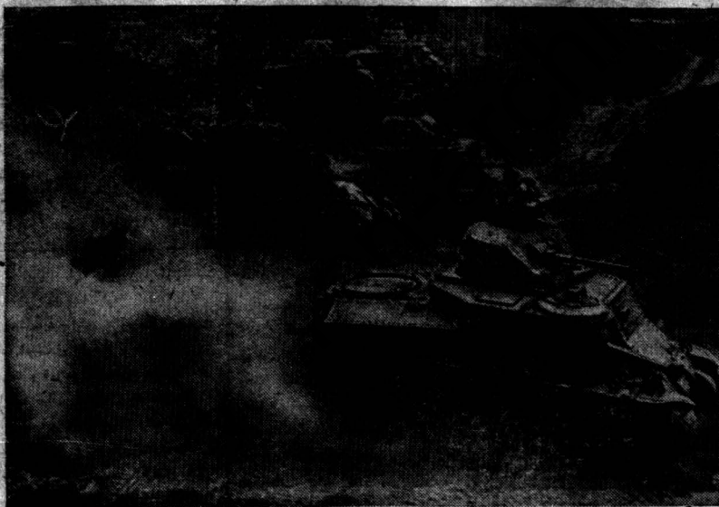
واحدهای زره پوش امریکائی که برای حمله با اروپا مشغول تمرین عملیات جنگی هستند