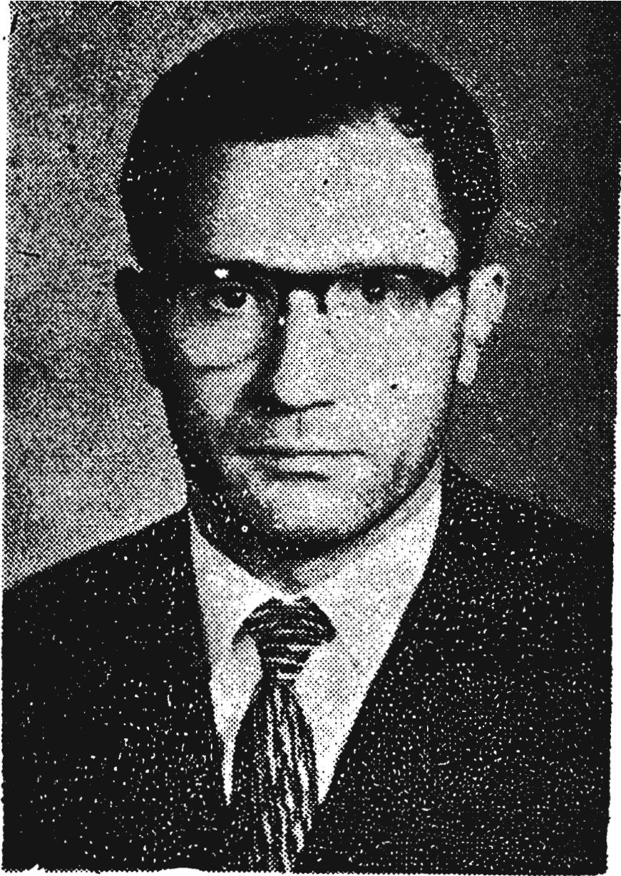
شهادت دکتر ابوالحسن خانعلی در ۱۲ اردیبهشت ماه ۱۳۴۰ آتش قیامی را برافروخت که سراسر کشور را فرا گرفت