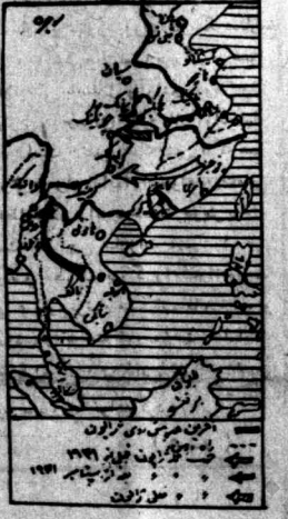
بقیه در صفحه ۲

در این شش سال زاین برای نیل به پیروزی قطعی بنام مسائل مشتت گردیدند و از تمام طرق تاکتیکی و جنگی و سیاسی استفاده کرده است. ابتدا تاکتیک وی این بود که بوسیله مانورهای سریع و