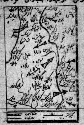
هواییهای شوروی اسلاو، کول، اونچرا بمباران کردند

۵۸۶ تا ۴۰۴ هوایی آلمانی در یکروز نابود گردید