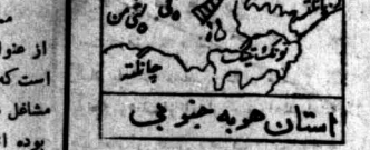
استان هر چه جنوبی

چیره بندی کوبنهای پیش خریدار و فروشکد جا میزند و قند و شکر آنرا هم قیلا و یا بعد بصرف فروش رسانند و یا میسرانند نتیجه این میشود که پنج روز است هر خانواده شبهه قند مراجعه میکند مایوس بجای خود بر میگردد گله هم برای گول زدن مردم بجهت تفر میفرستند و میگویند تمام قند مضطک تر اینکه از همان عاملین فروش بلا قاصلی توانید قند سیری ده رسال بنرخ آزاد خریداری کنید وقتی دولت این فدوی قندش و علی را می بیند و چشم پوشی میکند برای هر عاقلی این توهم و تصور دست میبندد که فروشگاه ویا وزارت خوار بار در این سوه استفاده ها و این رفتار ناصواب دست دارد. بعلاوه چه ضرر دارد که دولت مقدار چیره بندی قند و شکر را در برابر کم قیمت آرا هم از نرخ فعلی پلو برابر ترقی دهد و در مقابل فروش قند و شکر آزاد را اکیذاً قذف نماید و فروخته آرا مجرم بنشاند والا با کوبنهای بر از کوبن های غلی هین راه ها بدست آورده اند قیلا چنین هزار تومان کوبن کامل خریده اند که تازه معلوم نیست درست است یا غلی اصل است. یا باطل و برای آنها فرق نیست که کدام شاره نیمه مایع اختصاص داده میشود روزی همین نظر قند و شکر را که وزارت خوار بار برای مصرف اهالی بین آنها توزیع میکند قیلا بنرخ رایا به آنگه را بصرف فروش میسرانند. بعد بعضی اعلان جرایم و موقوف فروش قند و شکر