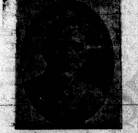
پروفسور سائس موسی احزاب کومک و آزادی و استقلال جمهوری چین

و در برابر روح آزادیخواهی ملی از پا در نیامد