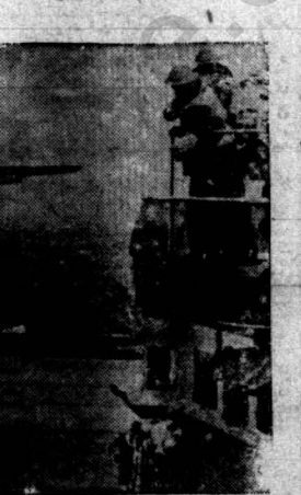
این هواپیما برای بمباران سواحل دشمن از روی این ناو هواپیما بر متفقین بیرون آمده است

اهمیت استیلاب سیسیل: پس از سقوط تونس و اشغال جزایر بانتالیا و لامپدوزا و لیبوزا از طرف متفقین تنهایی که در سر راه کاروانهای دریایی آنها