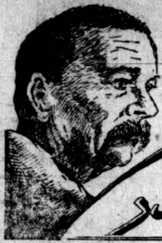
ترجمه علی اصغر روش

۱۸ - اهل روسیه منبرآهت جواب داد: که من... پاول حرف او را قطع کرده اظهار داشت: چرا بگویم؟ مادر صدای خنده اهل روسیه صغیر را شنید. من میدانی عقیده دارم که وقتی انسان دختری را میخواند باید بوی اظهار شایه و گرنه هیچ نتیجه ای ندارد.