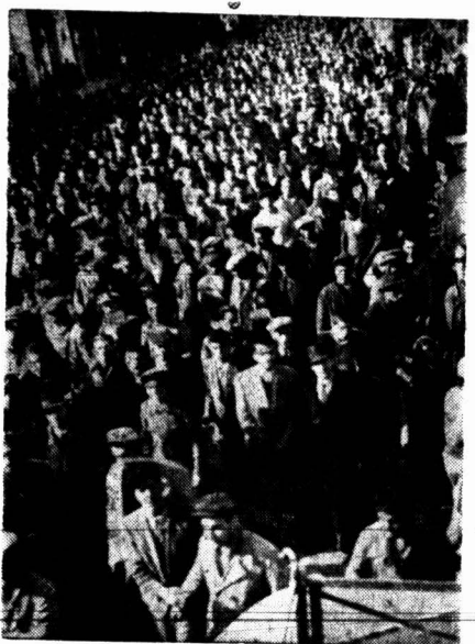
منظره یک قسمت از جمعیتی که جنازه را تشییع مینمودند در خیابان سپه

یونان، سرزمین علم و فلسفه، کشور شعر و هنرهای زیبا، کاهواره نواکراسی جهان سه سال است در آتش بیدادگری کورتنکی و فشار بیرحانه میسوزد. شهرهای فرخنده آن که بزرگترین موزه هنری و تاریخی گیتی است و روزگاری سرزمین عشق و شراب بود در زیر چکمه های نیروی مهاجم لکد کوب و پامال شده و ویران گردیده است. ملت یونان ملتی که این همه تاریخ تمدن بشری خدمت کرده است، ملتی که در هر دوره تاریخ خود نمونه شجاعت و آزادی خواهی بوده است در زیر شکنجه اشغالگران و زجر میکشد. شهرها را غارت کرده و سران را به اسارت گرفته اند. مردم گرسنه، فقر و تعطیلی سراسر این کشور تاریخی را عذاب میدهد. چراغها باین جرم که میرواستند بخت و خواری در برابر امپریالیستهای آلمانی تسلیم شوند، فقط برای اینکه بروش و شیوه آبه و اجداد خویش در برابر زورگویان مقاومت کردند و مرگ با شرافت را برون گزینند ترجیح دادند. غیرهائی که از وضعیت اسفناک این کشور بیخبرند نشان میدهند که چه فجایع رقت انگیزی در این کشور جریان دارد. در شهر آن و سایر شهرهای مهم دسته دسته مردم از گرسنگی تلف میشوند در هر مدت جنگ جمعیت آن نصف تقلیل یافته است. روسا لشکری آلمانی مرتباً دسته دسته از مردم این کشور را بپشتان گروگان قتل عام مینماید، سرباز آلمانی و فرماندهان آنها آخرین شیره جان اهالی یونان را میکشد و بیرون ناز شست با آلمان میفرستند باین حال در حس مبارزه جوئی ملست