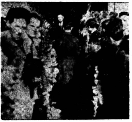
هیئت دولت هنگام تشییع جنازه