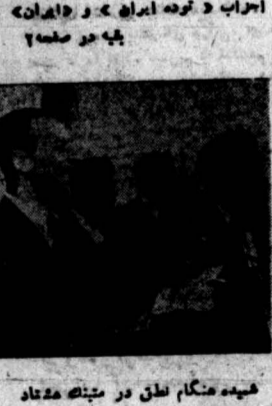
شمیده هنگام نطق در میتینگ مشتاقان عزای نریخته فرانسکو

پیر شکوه سی هزار نفری خود نسبت به جابجای شرکت نفت انگلیس اظهار تنفر مینمایند راهبر تبریز (دیشب ساعت ۹) امروز ساعت ۵ بعد از ظهر ۳۰۰۰۰ نفر از کارگران تبریز در میتینگ قطبسی که در میدان انجمن ایالتی بزی اعتراض بجابجای شرکت نفت انگلیس در خوزستان تشکیل شده بود شرکت نمودند. آقایان تبریا از طرف کسبه ایالتی آذربایجان خطاب بکارگران چنین گفت رفقای زحمتکش