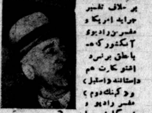
پروپگاندایست بر خلاف تبلیغ جریب امریکا و مفسر روزنامه آکتور که در با خلق برنر افتو کات هم داستانه (اسل) و و در کنگره دوم مفسر راوی و خبر کاران جریب

در آلمان شرایط ۱۹۳۲ وجود پیدا میکند نطق برنز همه امریکاییان را مایوس نمود