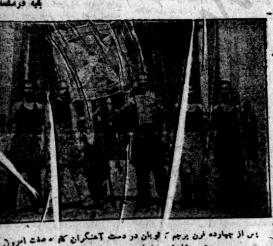
س از چهارده قرن برجم ۲ جوان در دست آهنگران کار صفت امروز و در پیشایش، بنوف نیرومند توده ایران