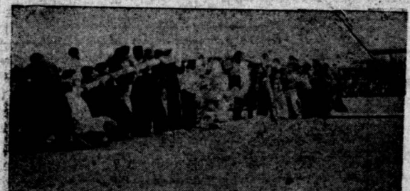
عده از یوئستگان و نمایندگان جوانان در