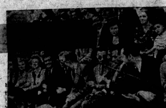
عده از یوئستگان و نمایندگان جوانان در