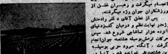
جوانان توده هنگام حرکت در راه