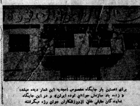
برای نخستین بار جایگاه مخصوص امجدیه این شمار دیده میشد، «رژه باد سازمان جوانان توده ایران» و در این جایگاه نماینده کان طبقی خلق آذربایجان جوان رژه میکردند