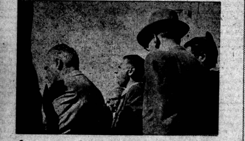
دکتر رادمنش عضو کمیته مرکزی حزب توده ایران عید باستانی و جشن تأسیس حزب را تبریک میکند

ترقی و توسعه فرهنگ در آذربایجان فصلی خشنوایی عضو هیئت تحریریه روزنامه آذربایجان اگر فراموش نکرده باشیم بکمال پیش از این آذربایجان از نقطه نظر شئون اجتماعی و فرهنگ با سایر نقاط ایران هیچ فرقی نداشت ، فرقی که بین آذربایجان و سایر ایالتها بطور محسوس وجود داشت این بود که حکومتاری و مرتجع گذشته با آذربایجان بیشتر از همه جا فشار میآوردند و میخواستند حقوق مردم آذربایجان را یکی از زمین پیرنه مردم آذربایجان در حالیکه برای این کشور تولید ثروت مینمودند ، باوجود اینکه قدرت خلافت سردم آذربایجان بطور شکست انگیزی در اختیار اجتماع چپ ، از همه چیز ، از همه چیز ، از همه چیز محروم بود ،