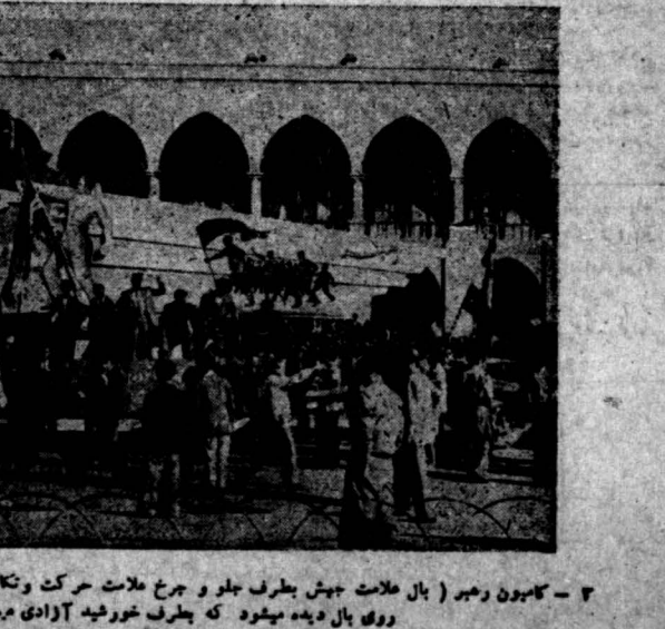
۳ - کامرون رهبر ( بال ملامت جیش بطرف جلو و برج ملامت حرکت و تکاپوست . جمعیتی با پرچم مسوونک روی بال دیده میشود که بطرف خورشید آزادی میروند )

انفرو خامه در کنفرانس صلح برخی از روزنامه ها از قول روزنامه « لا کروا باری » مینویسند که آقای اور خامه نماینده رهبر در کنفرانس صلح اظهار داشته است « هیچ لازم نبود انگلیس در صبره بیرونتر کر کند ، زیرا دولت ایران هیچ روی مردم ندارد پسانگ انگلیسها لطمه وارد آورد لیکن اسرار داده که کلیه نفوذهای غیر قانونی انگلیس از ایران رخت بریند . »