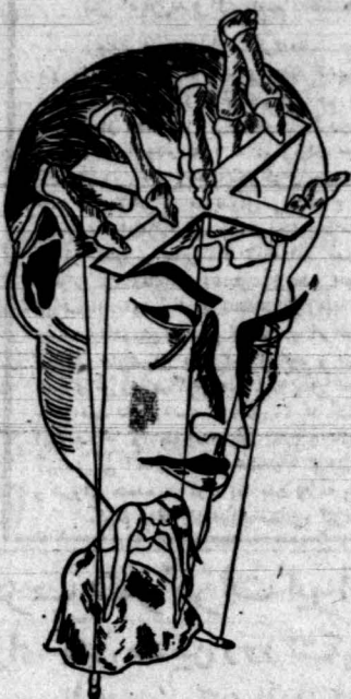
شبه دایره نشانات سازمان جوانان