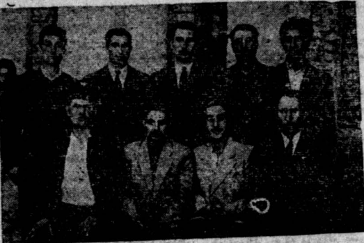
هیئت عامله شورای ولایتی اتحادیه کارگران ورامین

و میبخواهد در فرهنگ آبا (چون دوست سسبش شاپور بهرمان منتقل شده) نیز خرابکاری که لذا تقاضا داریم که برونده مشارالیه را بجز این اشته و او را به مسئول دیگر منتقل و حقوق حق بکشت آموزگاران که از صلحان خوش آب و هوای شمالی چون آذربایجان به‌ترین وظفه و خدمت بسمنومان خوش منتقل شده‌اند و فقط و فقط بوسیله قیاض حقوق آتایان پایال شده است از وی انصافه برای آموزگاران انبساط خود در کادوور دمویکراتی در برابر مقررات رئیس و مریوس یکسانته.