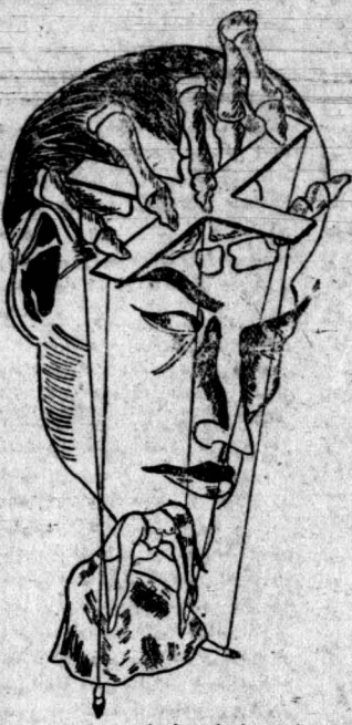
داره لایشات سازمان جوانان

زیودی بهترین اثر « صاحب التفاصيل » : فریدون توللی در زهر منتشر خواهد شد همه بخوانند و بدینگران نیز خواندن آنرا توصیه کنند