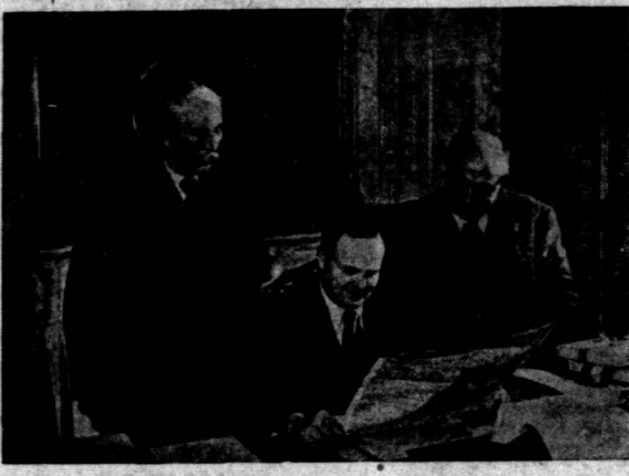
زادکولو رهبر پارلمانی و منشی حزب مورس تودر منشی کل حزب مارسل کاشن منشی حزب و سردیبر در امانیت ارگان حزبی

روزی که آقای توام السلطنه کابینه خود را تشکیل دادند و معرفی کردند با سیاست ایشان گذشته شد این سیاست در ترکیب اعضاء کابینه نهفته بود. وزرا همه از اشخاص بودند که لازم بود غوغای فارسی بوجود آید و مثلا بوزیری آقای هوزرا اعتراض نماید. با وجود این آزاد یخواهان ذبیق بودند که با چشم امیدواری بکابینه بنگرند زیرا: بعد از ۱۷ آذر موتی که کابینه آقای توام السلطنه سقوط کرد آزادی خواهان از او دفاع نموده و سعی کردند که تک حادثه ۱۷ آذر بناحق متوجه ایشان نگردد و حتی احتمالی که خود آقای توام السلطنه در کتبان جبران ضعیف نسوده آزاد یخواهان را دچار اشتباه نشود منحصرا حزب توده ایران بیانیهای انتشار داد و پرده از روی کار برداشت. یاد آقای رهاد بخیر که چیزی نمانده بود که در لویه تمقیقات غرق شود. قبیه در صفحه ۴