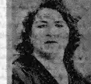
عاقبتی که عاشقان دل آزرده ...