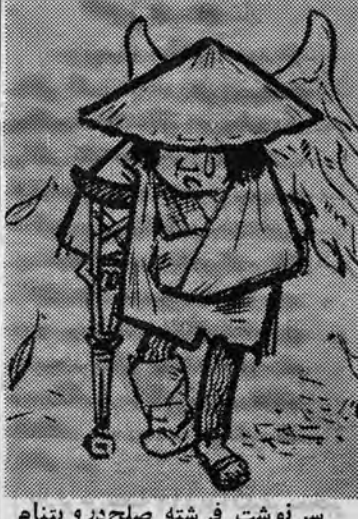
سر نوشت فرشته صلح در ویتنام

«پریرون» پزشکان، دانش‌آموزان آموزشگاه‌های بیاری و جمعی از کارکنان سرویس اول بیمارستان فیروزگر مسموم‌غذائی شدند آنها ظاهر پریروز در بیمارستان ناهار صرف کردند. ناهار آنها دله، چکرو اسفناج بود. آثار مسمومیت چند ساعت بعد آشکار شد و مسمومین تحت معالجه قرار گرفتند و معالجه شدند.