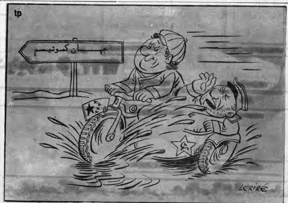
وصف حال رهبران جهان کمونیسم از نظر کاریکاتوریست

به دولت ایران خواهد بود. این کارخانه که در خوزستان نصب خواهد شد با ظرفیت ۲۰ هزار تن در سال شروع بکار خواهد کرد و بتدریج ظرفیت آن به یکصد هزار افزایش خواهد یافت. با توجه به نیاز فوق العاده بازرهای جهانی به آلومینیوم و مصرف فعلی کشور که در حدود ۸ هزار تن در سال میباشد و افزایش مصرف در آینده بصورت روبه افزایش است، و با توجه به بزرگ بودن سهم محمدرضا شاه تاسیس کارخانه تولید آلومینیوم در ایران کاملاً ضروری است. مسئله ای که در اینجا شایان توجه است شرکت دادن پاکستان در سهام این کارخانه میباشد. ما همیشه معتقد بوده ایم که بمیابست روابط بین ایران و پاکستان دیدیکر کشورهای اروپایی آسیا افغانستان و هند گسترش یافته تا منجر به ایجاد فدراسیون آریائی آسیائی گردد. این همکاری و دیگر همکاری های اقتصادی که بین ایران و پاکستان در چهارچوب پیمان همکاری های منطقه ای، بعمل می آید میتواند کام موثری در راه همکاری های بیشتر و همه جانبه آینده باشد.