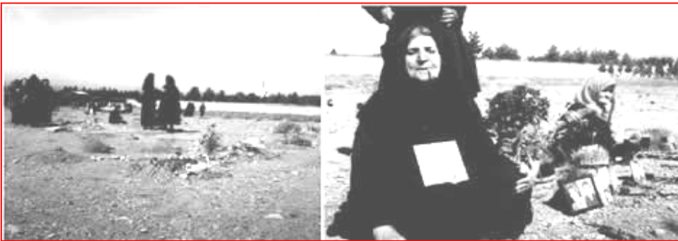
گۆری به کۆمه‌ڵی شه‌هیدانی ساڵی ۶۷- خ ————— اوهران