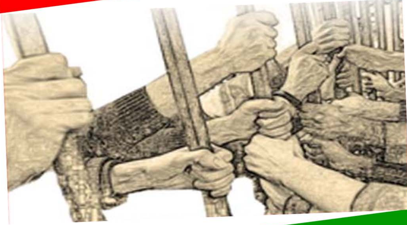
رېگای خوی نه دات و متمانه ناکاته

دهکات که ناغا زاده کان چون و به چ شیوه یه که گه شه یان کردووه و بوونه ته خاوهن سرووت و سامانی گشتی خه لک و چون هاشمی ره فسنجانی و ناتیق نووری و نه فرادی وهک نهوان خه زانه ی دوله تی یان گواستونه ته وه بو حسابه بانگیه کانی تاییه تی خویان و له حالیکدا خه لک روژ له دوی روژ هه ژارتر ده بوون له قه بی و