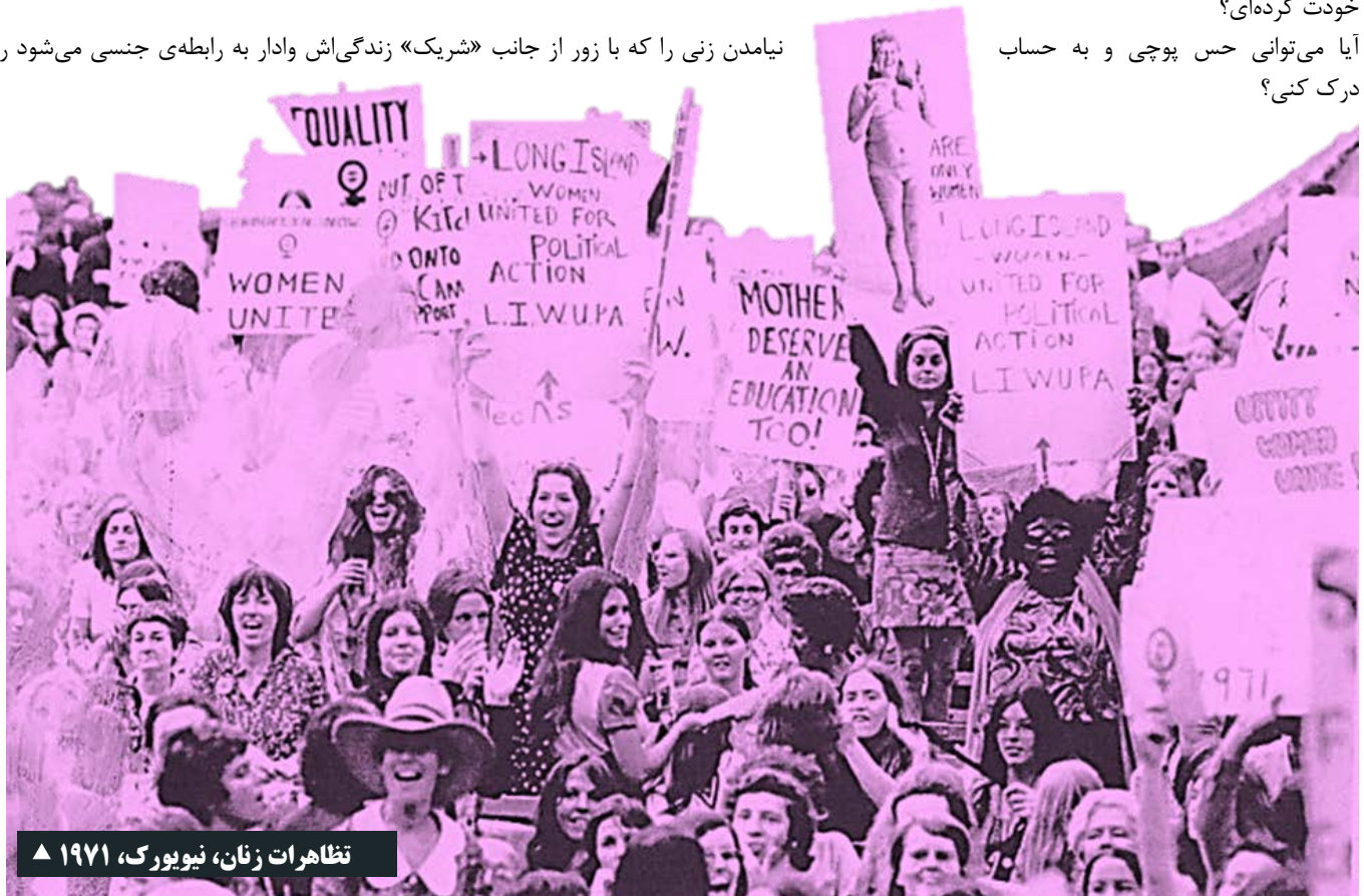
تظاهرات زنان، نیویورک، ۱۹۷۱ ▲