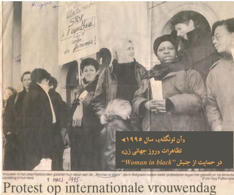
«آن تونگله»، سال ۱۹۹۵ تظاهرات «روز جهانی زن» در حمایت از جنبش «Woman in black»