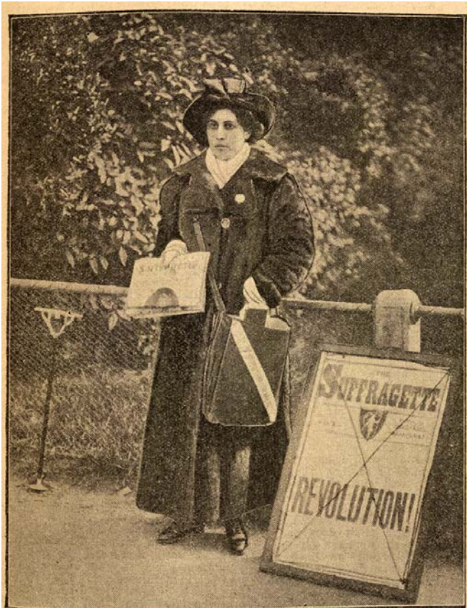
Princess Sophia Dhuleep Singh selling "The Suffragette" outside Hampton Court Palace, where she has a suite of apartments.

در این راستا، فیلم با نشان دادن صحنه‌هایی از برخورد بین کار فرما (سرمایه‌دار) و زنان کارگر (نیروی کار) در لباس‌شویی با نگاهی کلی‌تر مسأله‌ی نابرابری قدرت در روابط تولیدی نظام سرمایه‌داری را برجسته می‌کند. نظامی که نه تنها به از بین بردن، به طور عام، مناسبات طبقاتی و به طور خاص، فرودستی زنان (که قدمتش به زمان شکل‌گیری مالکیت