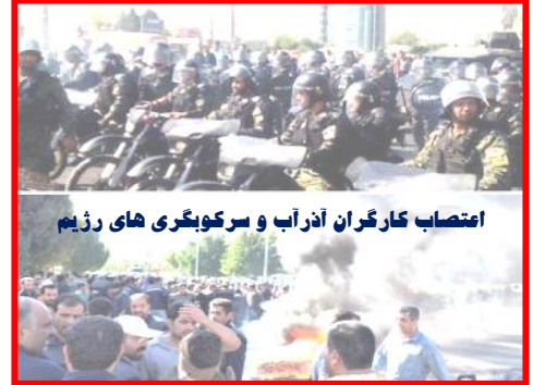
اعتصاب کارگران آذربای و سرکوبگری های رژیم

روز شنبه ۱۱ آبان ماه، حدود ۲۰۰ نفر از کارگران بازنشسته نیشکر هفت تپه با تجمع مقابل مدیریت این مجتمع خواستار دریافت مطالبات سنواتی خود شدند. یکی از کارگران می گوید: ما کارگرانی که از آذر ماه سال ۹۷ بازنشسته شده ایم نیز هنوز موفق به دریافت سنوات خود نشده ایم. کارگرانی که از کشت و صنعت هفت تپه بازنشسته می شوند دستکم ۷۰ تا ۱۵۰ میلیون تومان بر اساس سابقه کار سنوات دریافت می کنند. وی افزود: بعد از سالها تلاش توانستیم با استفاده از قانون مشاغل سخت و زیان آور از این کارخانه بازنشسته شویم اما ظاهراً کارفرما نبود منابع مالی را دلیل پرداخت نشدن سنوات ما عنوان می کند لذا آنها که از ادامه این وضعیت خسته شده اند تصمیم به برپایی این تجمع گرفته اند.