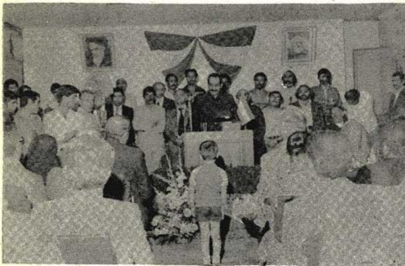
داریوش فروهر، به هنگام سخنرانی در زادروز مصدق

شادباش فرستاده بودند، سپاسگزاری کرد و به علت کمبود وقت از خواندن آنها پوزش خواست. پس از پذیرائی کوتاهی از شرکت کنندگان در این آئین، فیلم زندگی مصدق به نمایش گذاشته شد و در پایان طنزین شکوهمند سرود «ای ایران» فضای پرفسای حزب را پر کرد.