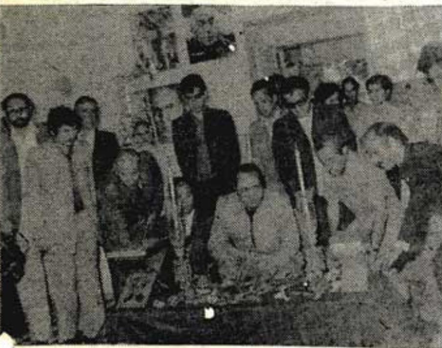
بامداد بیستونهم اردیبهشت، بر مزار مصدق

دو اصل آزادی واستقلال محور اساسی کوششهای مصدق است و دیگر کوششها و اقدامات او بدور این محور بنیادی در