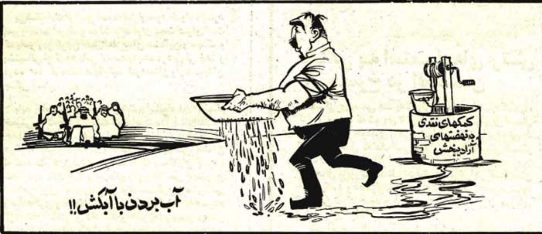
آب بردن با آبکش!!