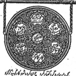
بر برادران و کارکنان شرکت فیروز

جریله شریفه روزنامه نیروی سوم هفتگی رونوشت روزانه آقای معوذ کالی رئیس فرهنگ لرستان که از کارمندان عالی رتبه وزارت فرهنگ می باشد با کمال جدیت بخدمات فرهنگی مشغول بوده کسانیکه با با تو کارهای گیتی نورد بتمام نقاط مسافرت کنید