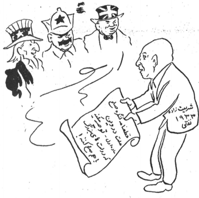
آن سفر کرده که صد قافله دل همزه اوست ۱۱۱۹