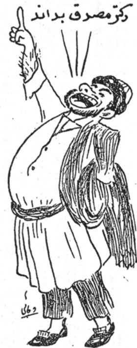
بناست طرح سه نوبتی اخیر بانک ناهنجار این خروس های یومحل ذبحشان را تسریع میکند

سوال - مقصود از کسر کردن ما بقیه در صفحه ۳