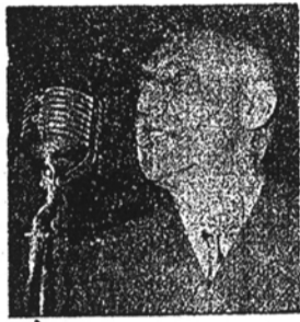
دکتر مصدق پیروز میشود