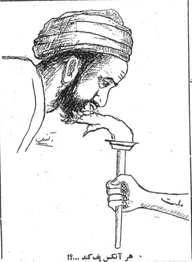
هر آنکس بف کند...!

به پیغم تصویب لایحه اختیارات، در روزنامه های مخالف چه انگار شده است... بسوی آینده که سر مقاله خود را برقرار مملود در ساعات قبل از تصویب لایحه اختیارات نوشته است مدانین این لایحه را «پست - ترین دشمنان مردم ایران» میدانند و با ذکر اینکه: «از مدانان لایحه تمدید اختیارات میتوان با مایه این لایحه بی برد» مینویسد: «بوروکرات های حقیر و واخورده ای نظیر شایگان وزیر زاده و خاتابین فرو - مبارزه ضد یهود در روسیه از چه زمان آغاز شد توطنه ادعای شوروی نشان میدهد که: ۱ - دولت شوروی موقیت داخلی خود را مترازل میبیند. ۲ - مبارزه ضد یهودی بزودی توسعه خواهد یافت» بقیه در صفحه ۲