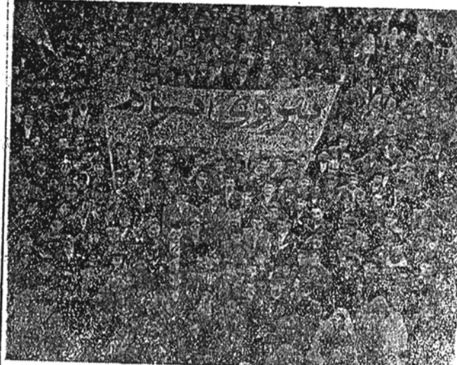
میتینک نیروی سوم در رشت برای تصویب لایحه اختیارات دکتر مصدق

در چند هفته اخیر که مداخلات برای حل مسئله نفت جریان دارد شایعات متعددی بگوش می رسد که همه حاکی از همین امر است. یکی دوبار شایع شده که مداخلات با اینست که مواج شده و باز خبر داده که طرفین تبادل نظر و مطالعه را از سر گرفته اند آنچه در خلال این جریانها محسوس است اینست که انگلیس با زیادت از دولت و معاف سیاسی مسئول متوجه اوضاع داخلی ما هستند و با ابایی که دارند صرف نظر از توطئه ها و اغلالهای که بوجود میاورند اطلاعات دقیقی از اوضاع ایران کسب می کنند و هر لحظه برای استفاده از ضعف و بدبختی داخلی ما در مداخلات و پیش نهاد های خود تجدید نظر مینمایند. برای پیروزی انگلستان و تعیین سروشست موسسات نفت و پرداخت فرامات متصفانه ما ناگزیر هستیم بداخله خود و شرایط زندگی ملت خودمان توجه داشته باشیم و شرایط زندگی را بصورتی تغییر دهیم که در آسودگی و رفاه برای