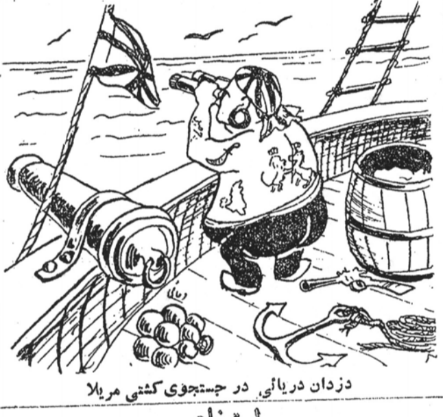
دردان دریائی در جستجوی کشتی مریلا

صاحب سوساله رندی به ارد مجتهد ولایت خودشان آمد و گفت چند روز پیش من در بیابان کوساله ای پیدا کردم و چون شنیده ام که در احکام شرع برای کسیکه چیزی پیدا کرده باشد و وظیفه خاصی قائل شده اند، بدین جهت خواستم از شما در این مورد استفاده ای کرده باشم و کسب تکلیفی کنم و به اینم کوساله پیدا شده را چکار باید کرد ؟ مجتهد که نمی توانست از روی مرتز ظاهر بشیر باطن بی برد استفاده رند می شنید میگفت: بقیه در صفحه ۲