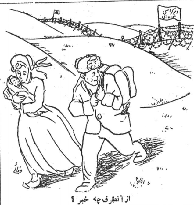
از آن طرف چه خبر؟

گوت باردیکر با ایران میآید. مدت قبول باز نشستگی - دادگاه ملی لهستان عده ای از «جاسوسان» را به اعدام محکوم کرد - تقدیم لایحه مطبوعات - مورتلارد معتقد است صدها مراکز صنعتی با ایران معامله خواهند کرد - جلسه هیئت نظارت