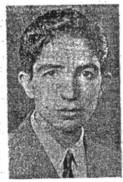
در خانوادگی کارگری متولد شدم. شاک نیست که نامایمات فقر، ناخوشی و غیره

«روزنامه میارز نیروی سوم در صورت موافقت شرح استعفای مرا در آن روز نامه درج نمایند» بیشتر در میان طبقه سوم جای خود را پیدا میکند. رنج، زحمت و محرومیت! همه و همه در میان طبقات دیگر کمتر جا دارد و با اسلا نیست. زندگی در شرایط فعلی برای افرادی طبقه سوم مرگ تدریجی است و اما به پیروی از قانونی که بر محیط جاری است منجم از زندگی محروم بوده و فعلا هم هستم. دوران طفولیت را متصل با مریضی دست بگیرم بودم. شش ساله بودم که وارد دبستان شدم، خصوصیات محیط در وضع تعلیم و تربیت بی اثر نبود. رشوه گرفتن، حق کشی، صورت پرستی و... همه از آموزی بودند که فرزندان طبقه محروم را رنج میدادند و میدهند. سال ۱۳۲۲ بود که در امتحان ششم ابتدایی موفق شدم. منتقدین در ایران بودند. بقیه در صفحه ۳