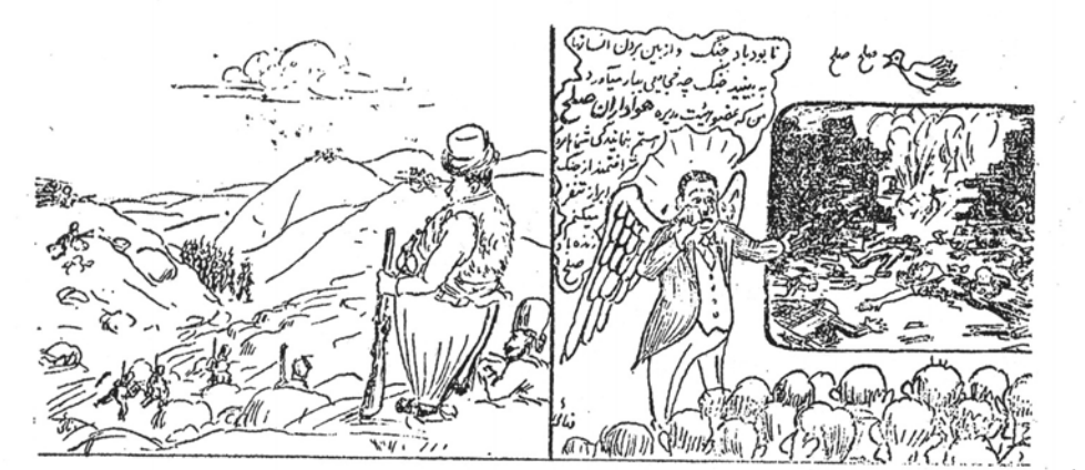
ابو القاسم خان بختیاری عضو رزمندگان هواداران صلح و یافی جنوب