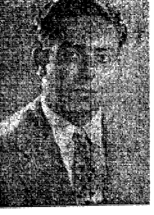
نامہ سر شادہ