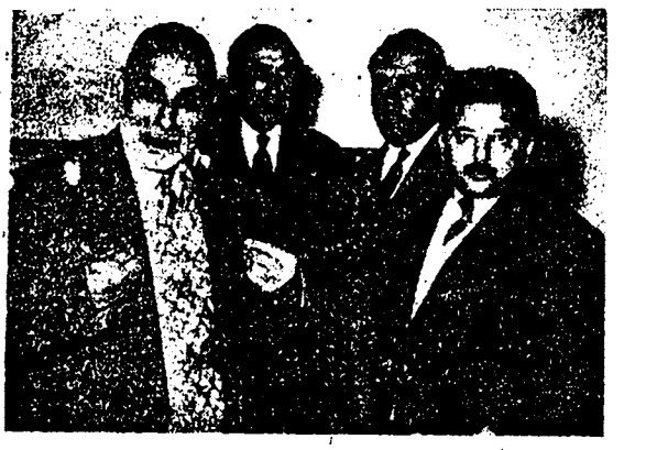
بیجان خودتان ، شما که میدانید ، تصویر از من نیست .... تصویر از شیطان است که بجای آدمها میروند

مکلا و معمم «مکلا» بروزن «مکلا» دولت ، بنی کیکه کلاب سردارد و «معمم» بسر وزن «معمم» بنی کیکه همام سرش گذاشته باشد میگویند بکنفر مکلا و دکتر معمم در باره یک موضوع علمی با هم مباحثه میکنند و هر کدام سعی داشتند که عقیده خود را بر دیگری تحمیل کنند . بعد از مفهاری سروکل زدن ، پوش پوش ، کارشان از مباحثه به مشاعره و بعد به مراسم کشید . معمم که از سرخنی مکلا عاجز شده بود ، خطاب با و فریاد زد : بیسواد! معلومات من از موهای سرتو هم تجاوز میکند ، چه خیال کرده ای! مکلا که این حرف را شنید ، فوراً کلامش را از سر برداشت . سرش طاس بود . ظریفی گفت : میزان معلومات آقا هم معلوم شد!