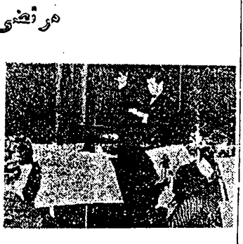
خانه در حال رهبری از کسره و نیک طهران

هر قضی حنا خانه واضح است که باین ترتیب جز معدودی کس دیگری نمی تواند خانه و هنر و استعداد او را بشناسد خانه در هنری به پایه استادی رسیده است که هنوز مردم کمبود از آن فراموشی کنند و تعجب در اینست که خانه باین که باروبا نرفته است و کسرو اتوار پاریس و بروکسل و وین را ندیده است معنی امروز می تواند کارهای وزارت و بیرون را اجرا بقیه در صفحه ۲