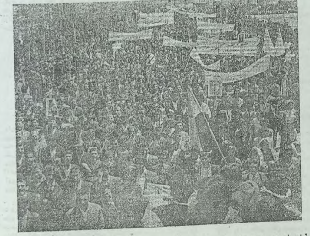
قیام ملت در میدان بهارستان مترقی ترین و فشرده ترین قشرهای ملت ایران پشتیبان دکتر مصدق است

چند خبر کارگری از آبادان رسیده است که بواسطه اهمیتی که دارند، ستون امروز را با اخبار آبادان اختصاص میدهم: کارگران گرمابه های آبادان نظیر کارگران گرمابه های کشور در شرایط سخت و طاقت فرسای بیکارمیشول اند. قانون کار در باره آنها اجرا نمیشود و با کثرت اجرا میشود. مخصوصا مواد اساسی و مهم قانون، نظیر بیمه کارگران در مقابل حوادث، بقیه در صفحه ۳