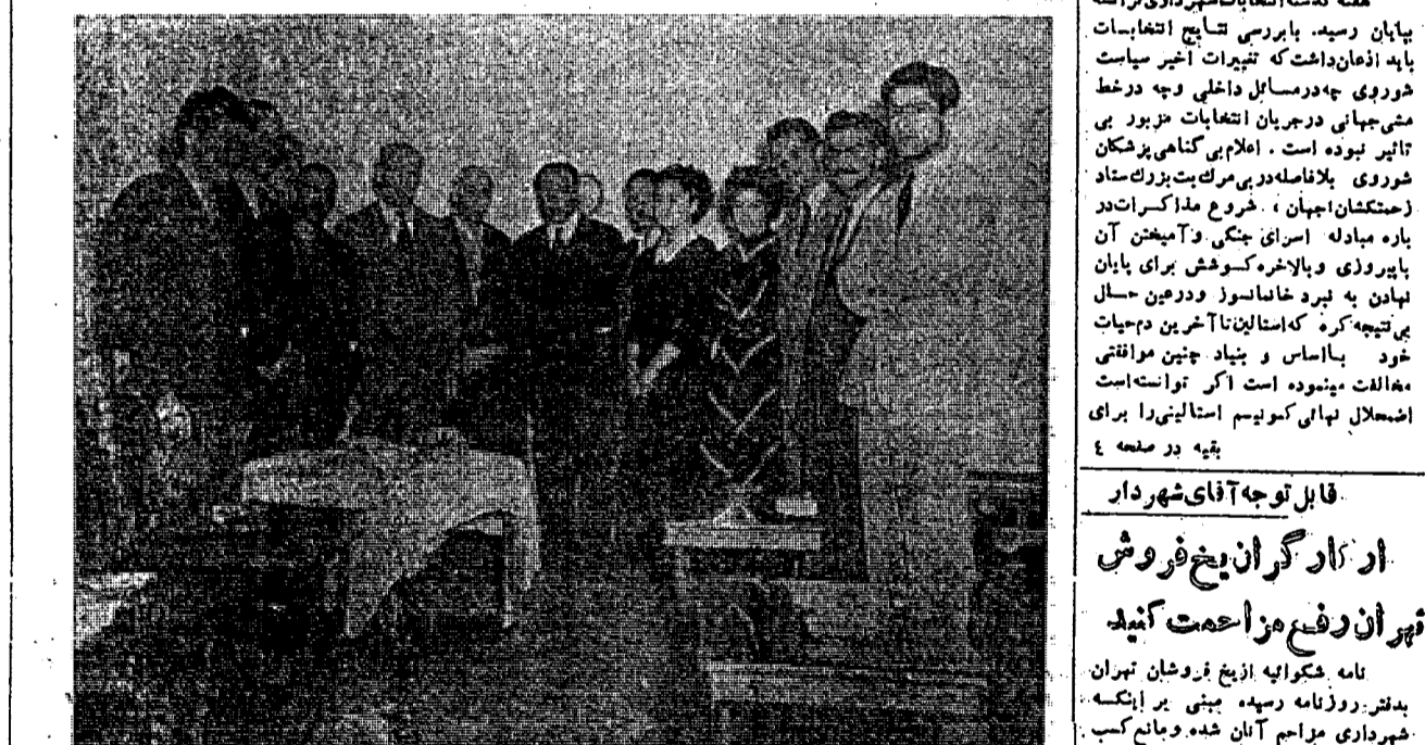
مفت گذشت انتصابات شهر داری فرمانده پیمان رسید. با بررسی نتایج انتخابات باید از همان داشت که تغییرات اخیر سیاست شوروی چه در مسائل داخلی و چه در خط منی جهانی در جریان انتخابات مذکور بی تاثیر نبوده است...

پیروزی نیروی سوم در انتخابات شهر داری فرمانده شکست و پایگاه اجتماعی امیر یالیسم در انتخابات شهر داری فرمانده گیمینر هیست ها و دو گلیست هاد و بر ابر و سالیست ها شکست خوردند