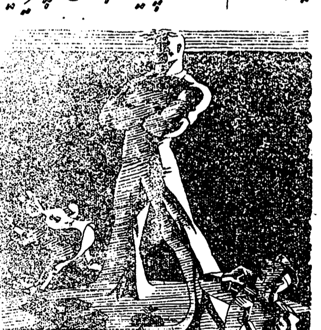
با اسناد و مدارکی از نشریات حزب توده روز شنبه ۲ خرداد منتشر میشود