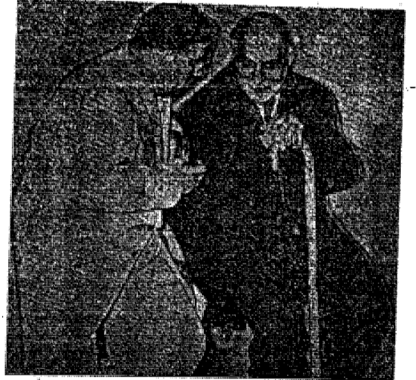
دکتر بقائی - من از لظن شا چیزی سرد نیاردم جاری زاده - اتفاقا منم مینظور!

حائزین زانه بر مزار پیشینان استوکس اشک حسرت میریزد - برای « باید و شاید » در راهنامه حزب کمونیست شوروی محلی از اهراب نیست!