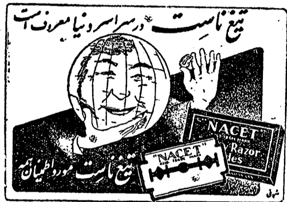
ش ۵۰۰ ۴-۴

از آقایانیکه بلیطهای سابق برای فروش برده بودند خواهش میشود برای عوض کردن بلیط های خود با آقای توکلیمان مراجعه نمایند