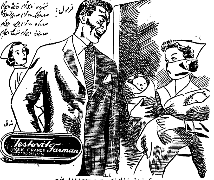
مرکز فروش خیابان ناصر حسرد بسده دارویی طوسی ۵۲۲ ش

قصر تستوویت دارایی کودکانی ضعیف و نحیف بود... ولی با مصرف قرص تستوویت شاد و سرگشته را در انوش گرفته و بابک اعجاب بخشی بچوگان قوی و سالم خود میگرد.