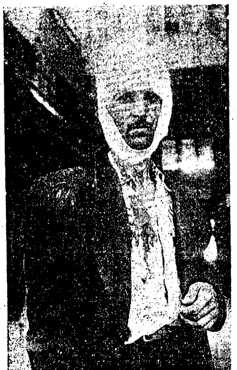
نمونه ای از مبارزات «منطقی» حزب «توده» هرش - عرض بر روزنامه نرزش که بدست چالوکنان «توده» ای مجروح شده و روزنامه بسوی آینده انبرده را چا فوکش معرفی کرده است.